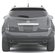
Cadillac SRX w/ Tow Package ONLY